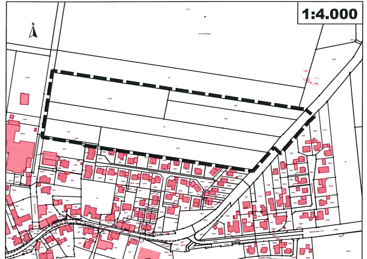
Kartengrundlage: Liegenschaftskarte, Gemeinde Lehre, Gemarkung: Flechtorf, Flur 5